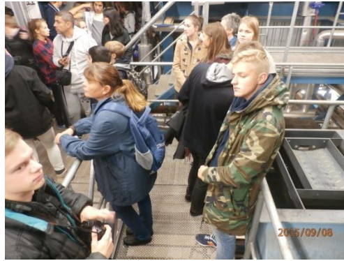
Ekskursijā pa Ekenas bioloģiskās enerģijas ražotni iepazīnāties ar dabai draudzīgu zaļās enerģijas ieguvi.