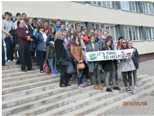
Liels paldies mūsu struktūrvienībai – Jaunolaines sākumskolai un Olaines 2. vidusskolai par jaukajām ekskursijām.