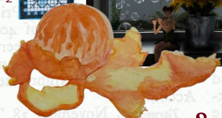
Taiga T.T. 11.ab