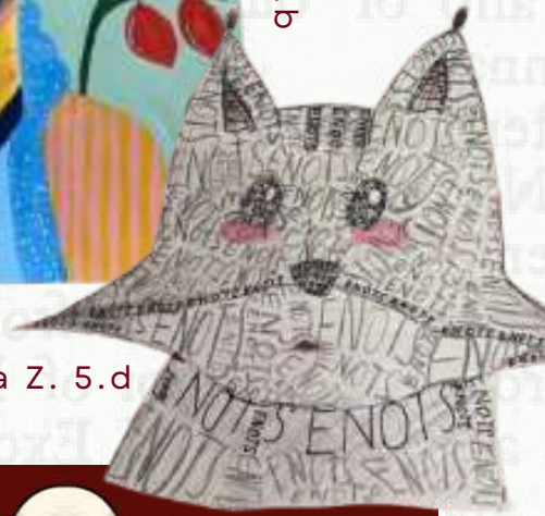
Sofija Z. 5.d